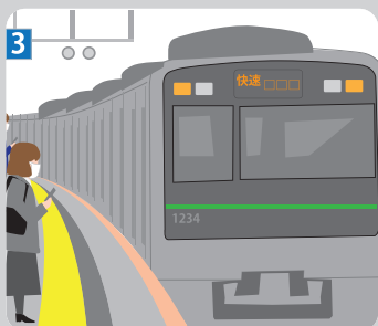
電車の乗り降りの際に