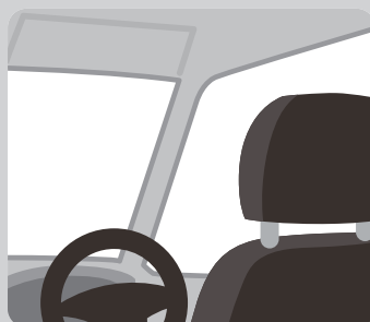
車の乗り降りの際にも